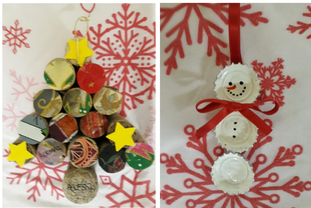
ALBERO CON TAPPI DI SUGHERO E PUPAZZO CON TAPPI DELLE BIBITE