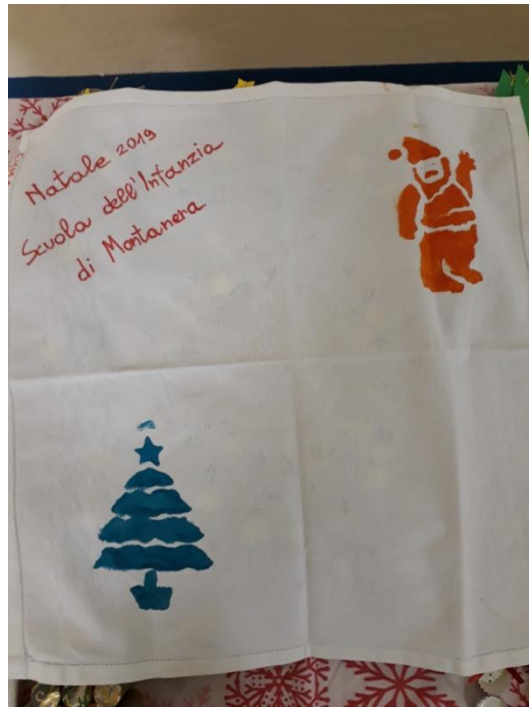
GNOMO CON STECCHI DI LEGNO E TOVAGLIOLO CON STANCIL