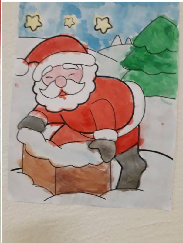
BIGLIETTO AUGURALE CON CARTA DI GIORNALE E POSTER A TEMA NATALIZIO